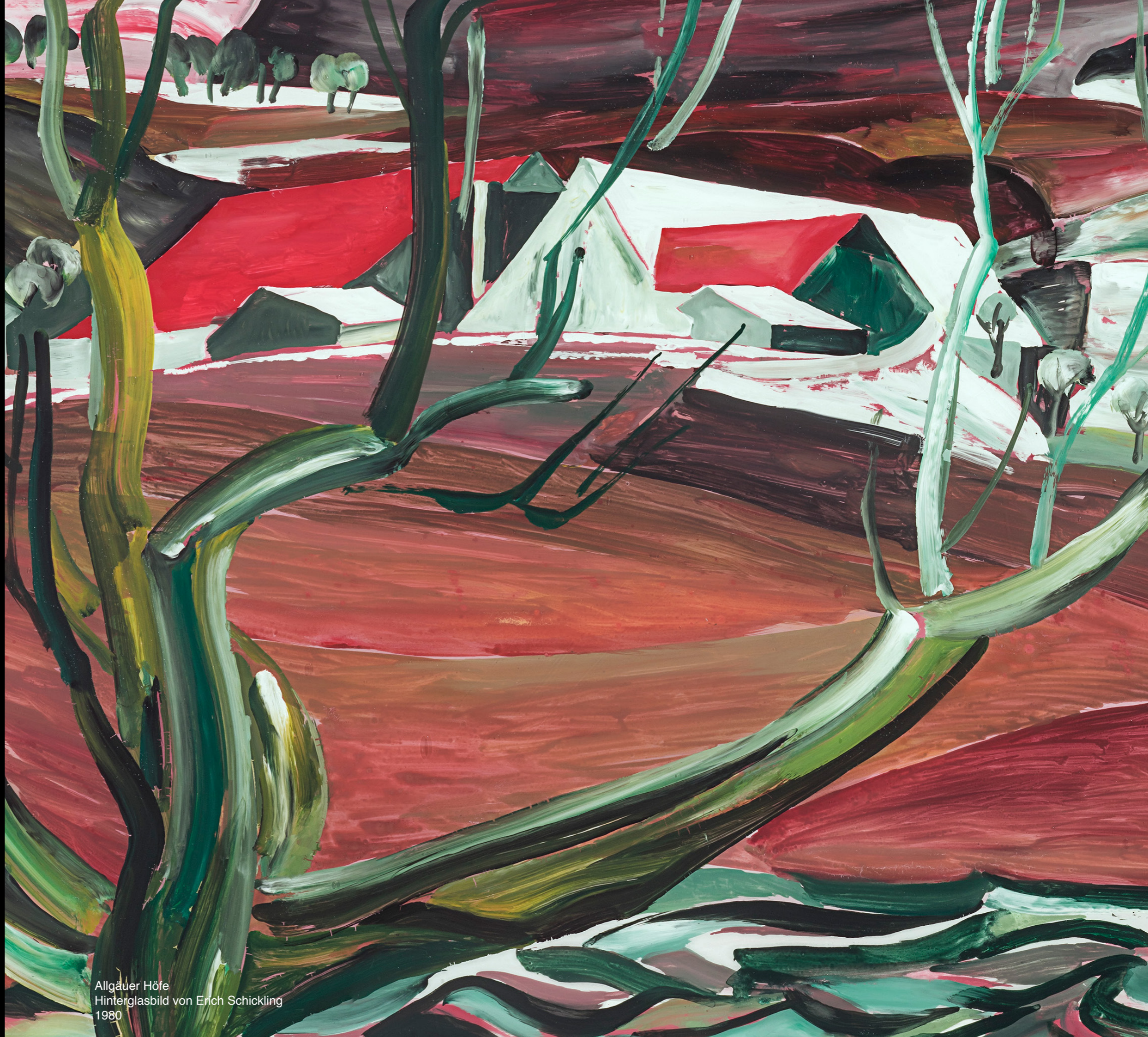
Allgäuer Höfe Hinterglasbild von Erich Schickling 1980